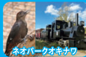
ネオパークオキナワ